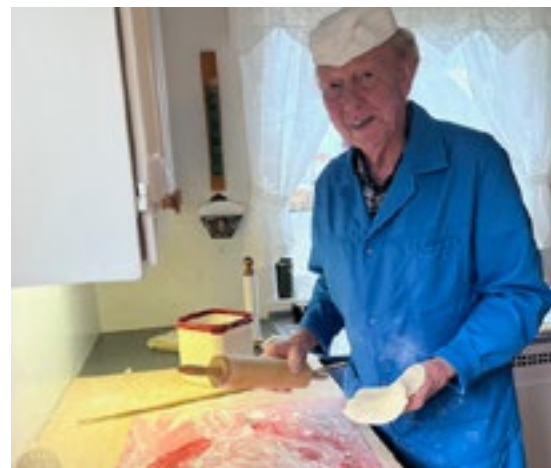
Haldor har god kompetanse både på baking og anna matlaging.

– Det er godt å ha ein Frelsar som er fast og stødig. Eg likar så godt Salme 23: «Herren er min hyrding, eg manglar ikkje noko.»