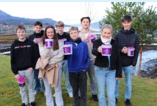
Her er konfirmantar frå Tresfjord og Vågstranda klare med innsamlingsbøsser

Nær 800 millionar menneske lever utan tilgang til reint vatn i verda i dag på grunn av jordskjelv, tørke, flaum, krig eller konflikt, men det er håp. Kirkens Nødhjelp jobbar med akutt bistand i katastrofar og med langsiktige prosjekt for å redusere naud og fattigdom i verda. Vi arbeider for fred og rettferd, og for å redde liv.